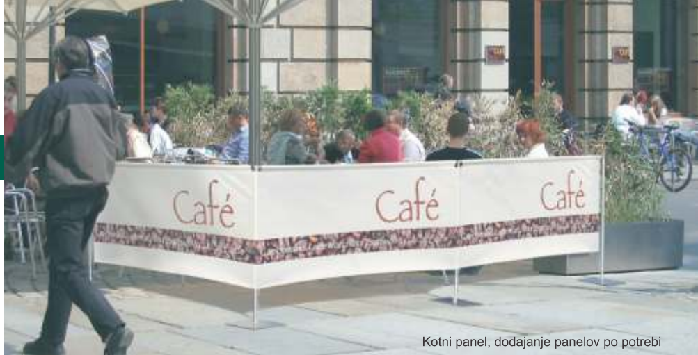
Kotni panel, dodajanje panelov po potrebi

prenosna reklamna sporočila na pregradnih sistemih za notranjo in zunanjo uporabo