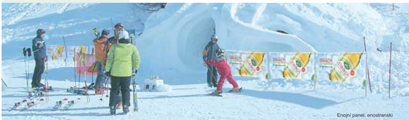
Enojni panel, enostranski